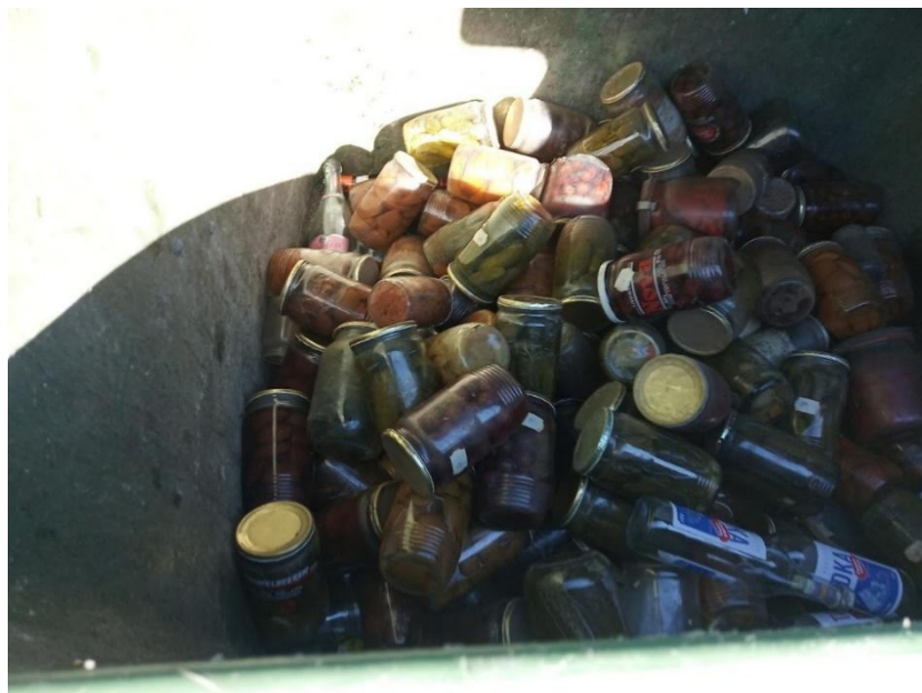
Nebyl to hezký pohled do jednoho z kontejnerů na sklo v září 2025